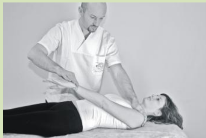
a cura di Cristian Sinisi (Kinesologo Specializzato) www.cristiansinisi.it

Usa i Muscoli, come Ambasciatori degli organi e delle emozioni